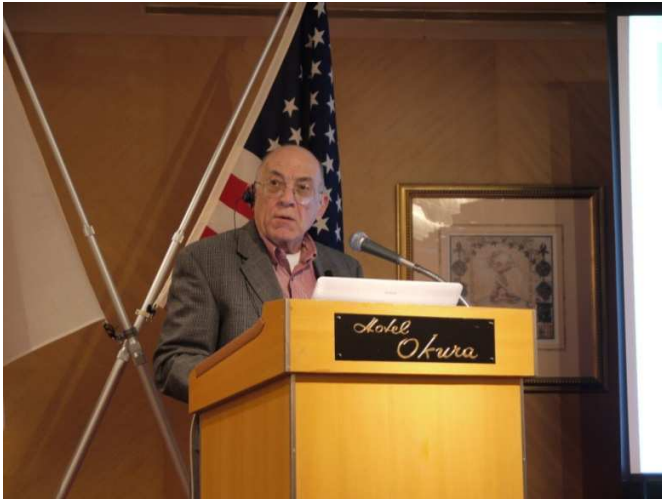
講演 ロイド・W・ルーニー 博士